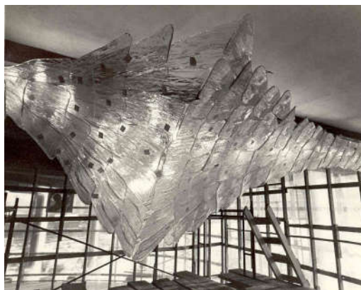
Installation d'un lustre en verre de Murano en 1963

En 1963, l'atelier Venini conçoit et fabrique 21 lustres recouverts de palmes en verre de Murano pour les foyers de la Salle Wilfrid-Pelletier. Cinquante ans plus tard, ces lustres ont besoin de plusieurs réparations qui nécessitent l'expertise de différents artisans. Afin d'effectuer ces travaux de réfection, les lustres seront décrochés en mars 2018 pour n'être réinstallés qu'en avril 2020. L'enlèvement des lustres nécessite l'installation d'appareil d'éclairage temporaire. L'objet du concours est donc « d'habiller » ces appareils d'éclairage temporaires et de dissimuler les supports des lustres.