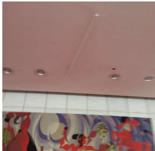
Vue d'un support au plafond