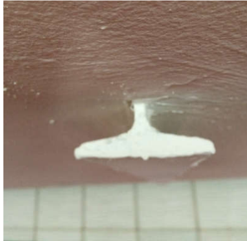
Vue d'une extrémité d'un support au plafond