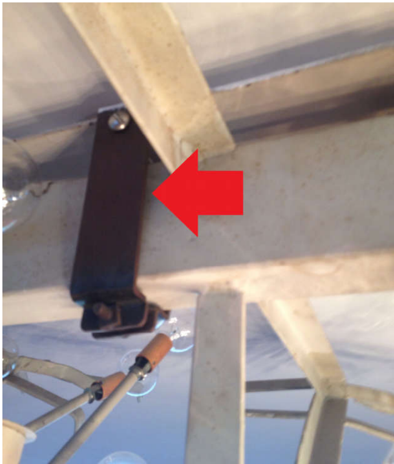
Attache des lustres existants